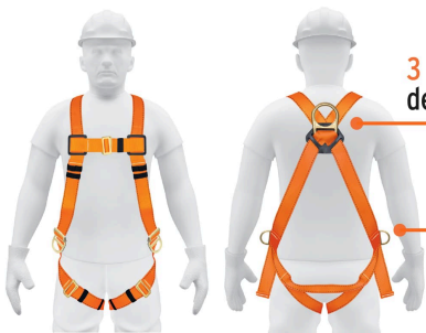
Anillos laterales para posicionamiento