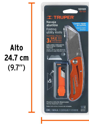
Alto 24.7 cm (9.7")