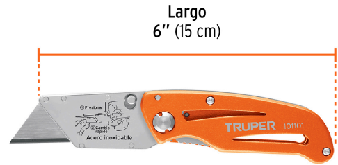
Largo 6" (15 cm)