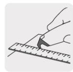
Hoja con perfil de gancho