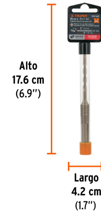
Peso: 0.04 kg (0.09 lb)