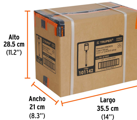
Contiene: 30 inner (150 piezas)