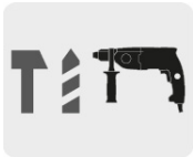
Para rotomartillos SDS Plus