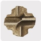
Punta de cruz