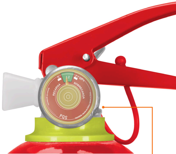
Manómetro robusto resistente a la corrosión con indicador de recarga y sobrecarga