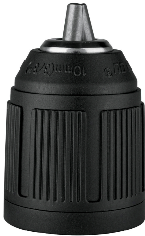
Cuerpo de nylon