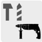
Para rotomartillos SDS Plus