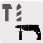
Para rotomartillos SDS Plus