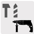
Para rotomartillos SDS Plus