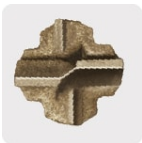
Punta de cruz