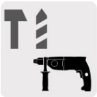
Para rotomartillos SDS Plus