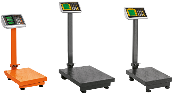
BAS-80PLA BAS-200PLAP BAS-100PLAP