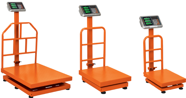
BAS-500PLA BAS-200PLA BAS-100PLA