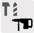
Para rotomartillos SDS Max