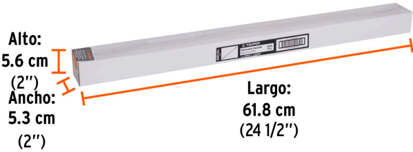
Contiene: 2 piezas