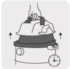
Asa de liberación rápida que facilita el vaciado