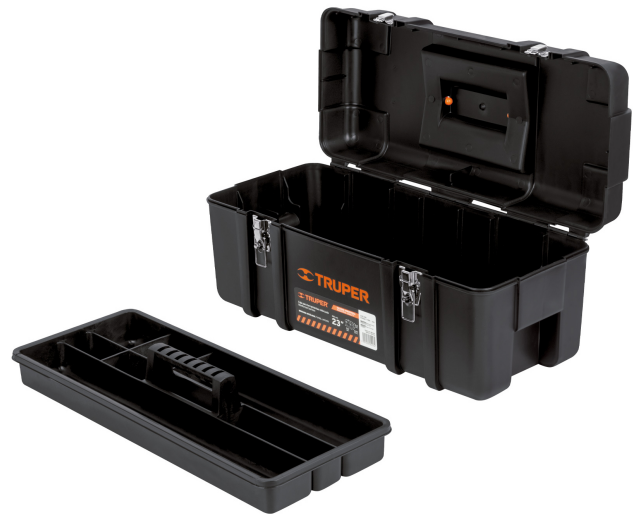
Incluye charola para herramienta pequeña