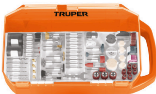
Estuche organizador que facilita el almacenamiento de los accesorios