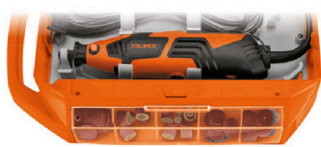
Compartimento posterior para herramienta y compartimentos laterales para accesorios