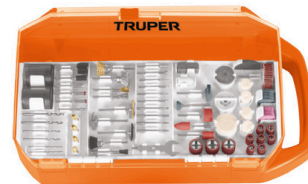
Estuche organizador que facilita el almacenamiento de los accesorios