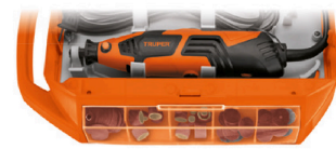
Compartimento posterior para herramienta y compartimentos laterales para accesorios