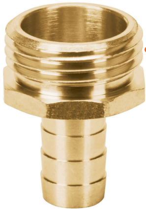
Conexión macho 3/4"