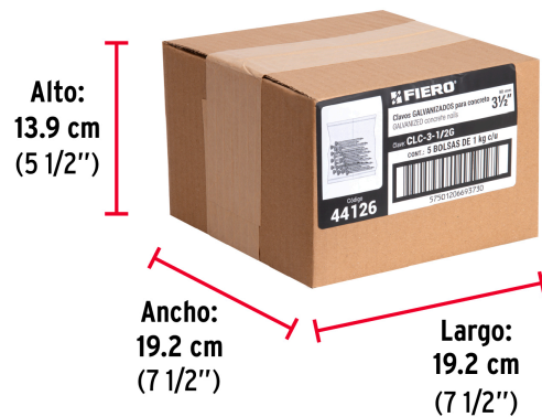
Contiene: 5 piezas