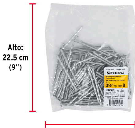
Largo: 19 cm (7 1/2")