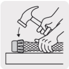
Fácil de instalar