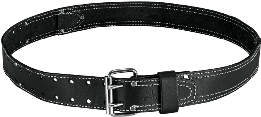
Hebilla de doble pin para un ajuste seguro