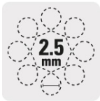
Diámetro de órbita