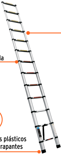
Fabricada en aluminio

Seguros deslizantes que permiten ajustar a la altura deseada