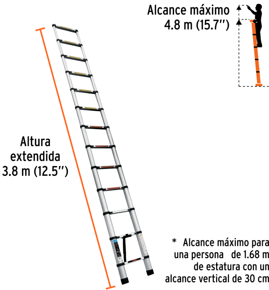
Altura extendida 3.8 m (12.5'')