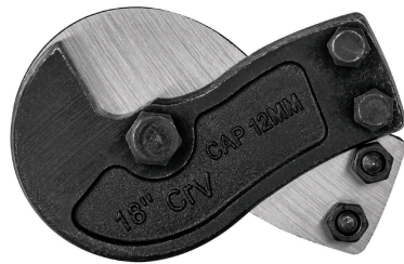
Cuchillas de acero al cromo vanadio en forma de gancho