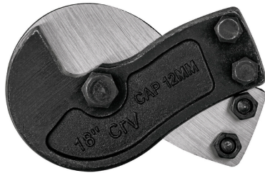
Cuchillas de acero al cromo vanadio en forma de gancho