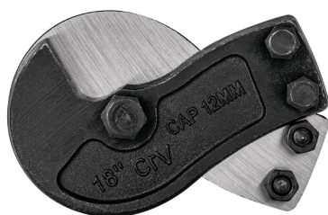
Cuchillas de acero al cromo vanadio en forma de gancho