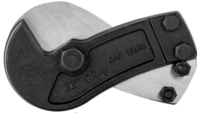
Cuchillas de acero al cromo vanadio en forma de gancho