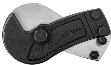
Cuchillas de acero al cromo vanadio en forma de gancho