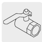
Salida para manguera de 3/4"