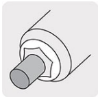
Bornes con conector rápido