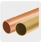
Metales no ferrosos (cobre y latón)