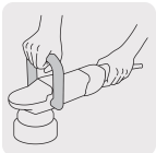
Mango abatible tipo "D"