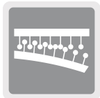
Sistema de fijación hook and loop