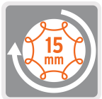
Movimiento orbital, no genera remolinos