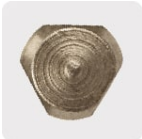
Zanco P3 antiderrapante