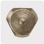
Zanco P3 antiderrapante