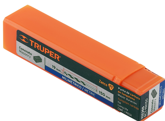
Largo total 150 mm