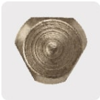
Zanco P3 antiderrapante