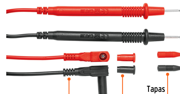
Sondas de ángulo recto