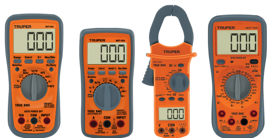
MUT-60A MUT-50A MUT-202 MUT-105