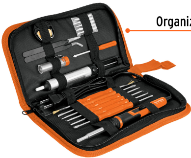
Organizador de PVC