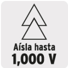
Aísla hasta 1,000 V