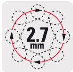
Doble movimiento: elíptico y rotativo