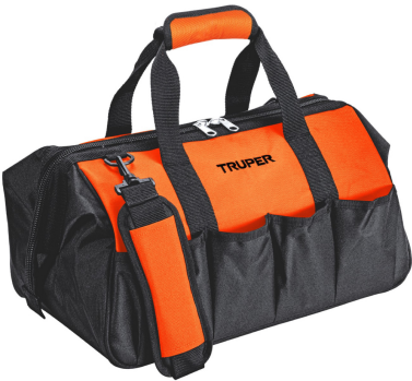
Incluye maleta portaherramientas de 16"