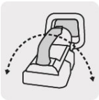
Mango de 3 posiciones