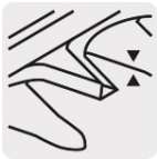
Cuchillas de doble filo