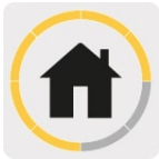
Uso residencial frecuente