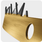
Dentado tipo americano