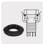
Empaque antifuga con diseño cónico