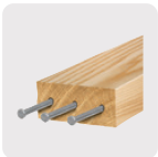
Madera con clavos