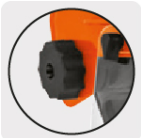
Perilla para ajuste