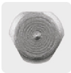
Zanco P3 antiderrapantes