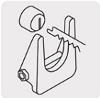
Sistema de cambio rápido