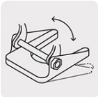
Zapata ajustable tipo pivote