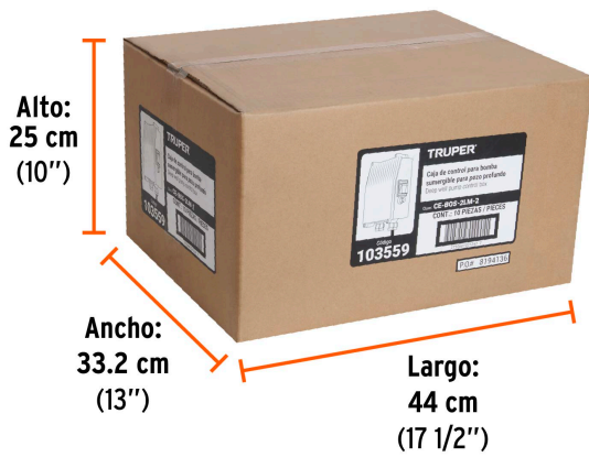
Contiene: 10 piezas