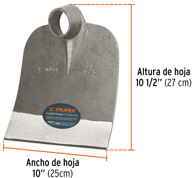
Altura de hoja 10 1/2" (27 cm)